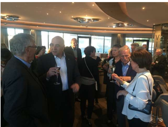
Restaurant Elements der BHS