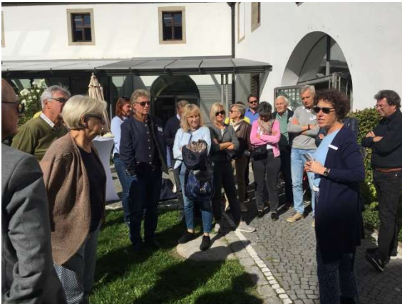
Innenhof des Waldsassener Kastens